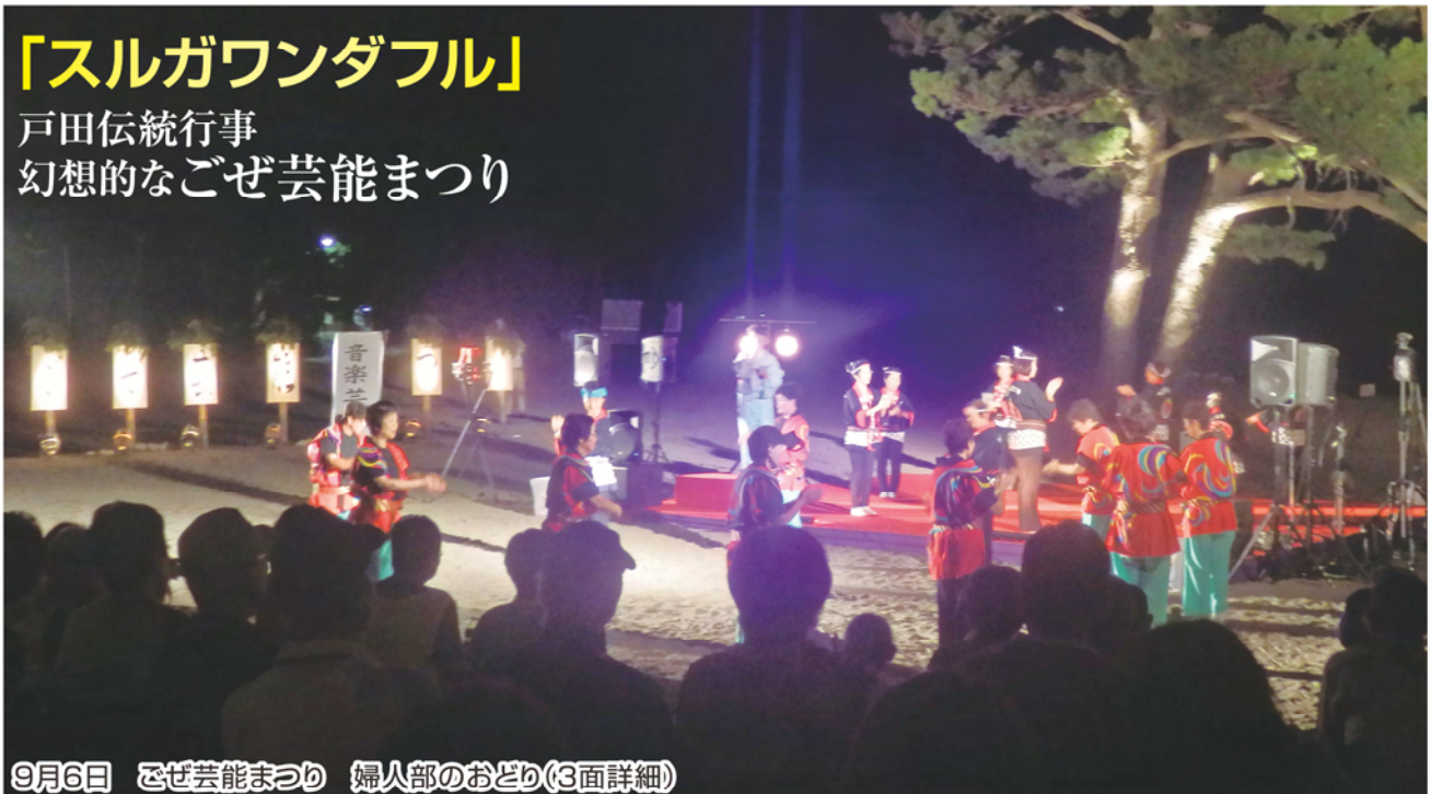
9月6日 ごぜ芸能まつり 婦人部のおどり(3面詳細)