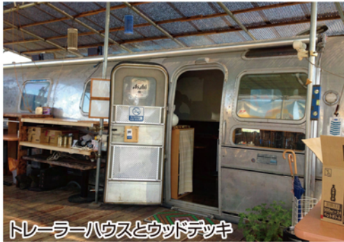
トレーラーハウスとウッドデッキ

特徴 平成二十五年十月トトレーラーハウス型ダイニングをオープン。主にピザとパスタとお酒を提供しています。お店はトレーラーハウスとウッドデッキによるアウトドア的な異空間です。実家の前の