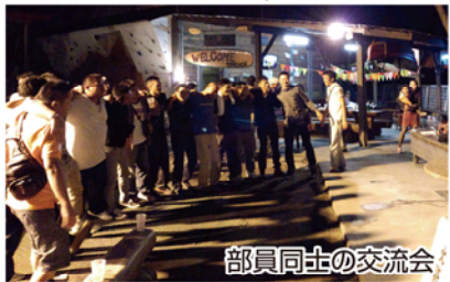
部員同士の交流会